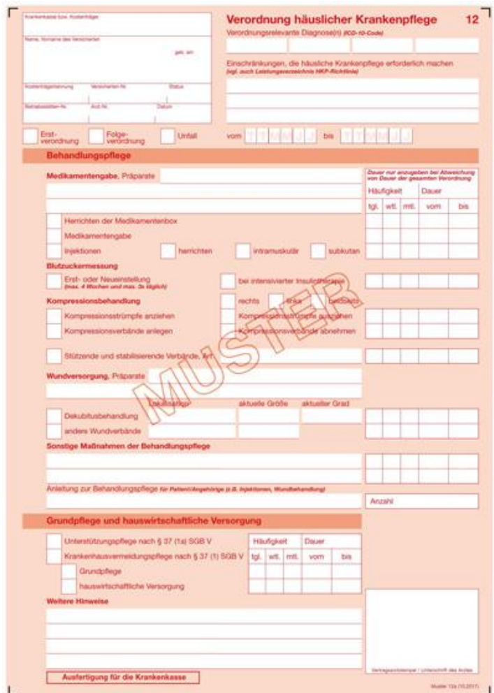
Abbildung 1: Muster Verordnung häusliche Krankenpflege

Basis der Beantragung der Leistungen nach SGB V ist die Verordnung durch Ihren Arzt. Diese muss von Ihnen unterschrieben werden und fristgerecht an Ihre Krankenkasse versendet werden. Die erstmalige Verordnung ist auf 14 Tage befristet und muss dann neu angefordert werden. Spätestens nach drei Monaten muss wieder eine neue Verordnung bei Ihrem Arzt beantragt werden. Bei Fragen zu diesem Ablauf stehen wir Ihnen gerne zur Verfügung. Möchten oder können Sie sich nicht selbst um die Verordnungen kümmern, bieten wir dieses komplette Procedere als Serviceleistung für Sie an (Selbstzahlerleistung). Sprechen Sie uns an.